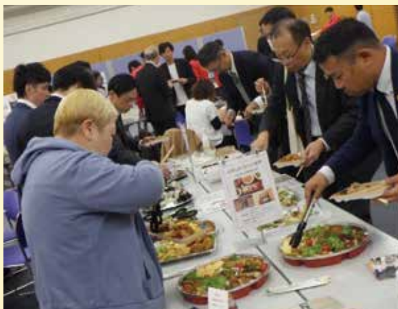
交流会を彩る7店舗の多彩な料理