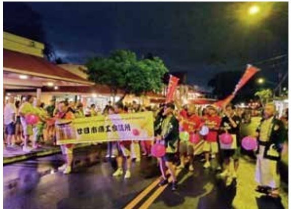
廿日市商工会議所をアピールしながら練り歩いた

今回はオープニングイベントとなるランタンパレードに参加しました。スタート前に雨が降り始め、実施が心配されましたがスタート時には雨も止んで沿道には大勢の観客が集まり、温かく出迎えてくれました。参加者は思い思いのランタン（提灯）を持って、沿道の子供たちにお菓子を配りながらカイルア・コナのメインストリート「アリイ・ドライブ」を練り歩きました。