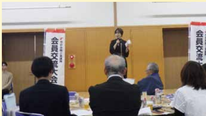
参加者の前で自社サービスを熱くPR

希望者による1分間の事業PRタイムや、自社製品を紹介できる展示ブースも設けられ、参加者同士が積極的に情報交換。7つの飲食店による多彩な料理も並び、会場を華やかに彩りました。終始にぎやかな雰囲気の中で、新たなつながりが生まれる有意義な会となりました。