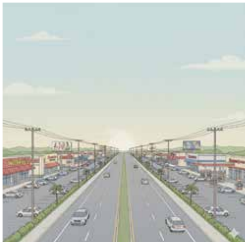
Geminiにローカル幹線道路沿いに全国チェーン店が並びどこも似たような風景、というイメージのイラストを描いてと頼んで描いてもらったイラスト

めのハードルは年々あがっているのが現実。そんな中、どうして日本全国似た風景になったのか、それは消費者が全国チェーンやNBを選んでいるからです。ジョブチューンのジャッジ企画のような、商品やメニュー開発の裏側を掘り下げた番組は、仕入れや開発担当者の涙ぐましい努力が垣間見えてよく視聴するのですが、大手がこれだけ試行錯誤して素材を吟味しクオリティをあげ、大量生産でありながら手作り感もできるだけ出している中で（とはいえ、大手だからこそ最終的には数量で利益が取れるからできることではある）、ローカルの個店は、どうやって闘えばいいのでしょうか。円安が定着し、仕入れ数量も少ない地方の中