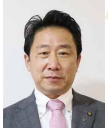
廿日市市 市長 松本 太郎