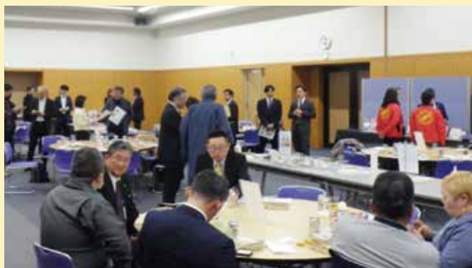
ご参加いただいた皆様、ありがとうございました。