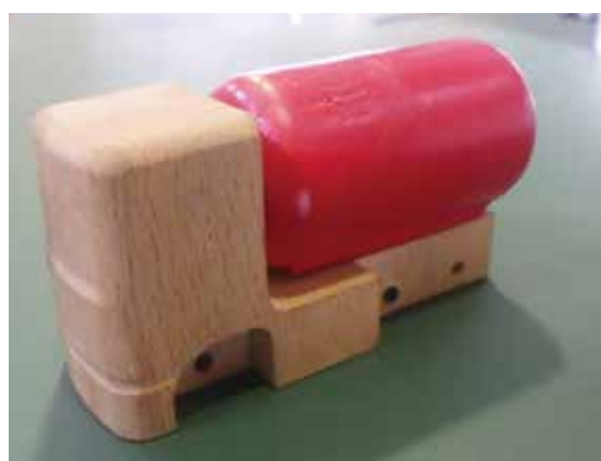
開発中の木製ミニカー。出来る限り広島県産の木材を使用し、地域資源を活用している。

の従業員は高いプロ意識を持っており、皆で連携しながら、良い品質のものを作ってくれています。それに加えて、チェック機能を強化して、不良品を出来るだけ削減しています。今では品質の高さ、不良品の少なさで評価されるようになってきました。