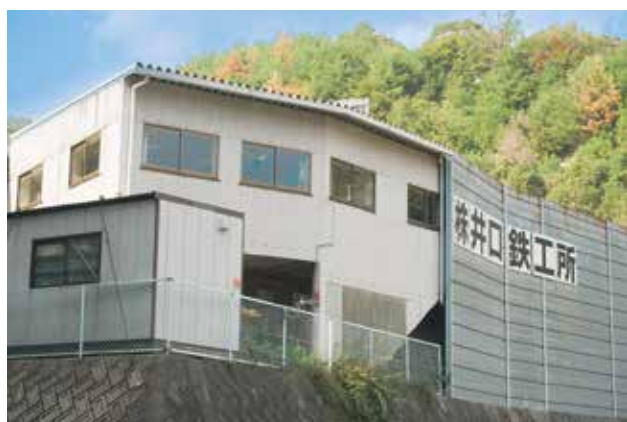
宮内の工場。移転当初は余っていたスペースもあったが、現在は手狭に感じるほど従業員が増えた。

自動車用部品の製造を始めたのは2代目のころ、原爆でダメになった流川の工場を井口に移転してからです。移転後しばらく