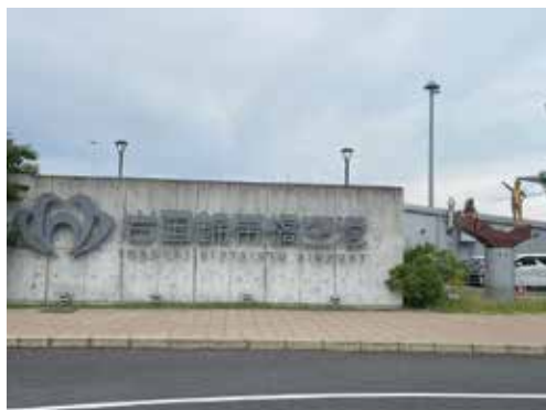
廿日市市役所から約30km、車で1時間かかりません。