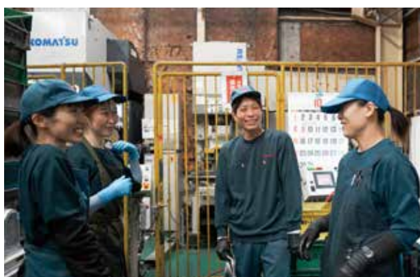
風通しの良さと一人一人のプロ意識が、安心できる品質を生み出している。