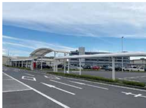
搭乗者は5日間無料の駐車場。たまに満車のことがあるらしいですが、私は置けなかったことはありません。

うこともありませんが、結局早得を取ると変更出来ません。普通の予約だから変更しようと思っても、東海道新幹線の激混みで直前だと良い席が無く、結局変更しないこともしばしばあります。ということ、ビジネスタウンとしても廿日市はなかなかいいポジションと言えるのでは？