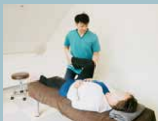
一人ひとりの体の状態や痛みに合わせて、マンツーマンで施術しています。 (パーソナル25分 3,960円)