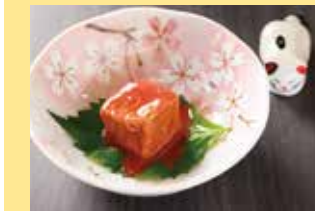
▲豆腐饅 500円(税込) 酒粕などで漬け込んだチーズのような食感が特徴。こちらを少しずつ口に運びながらアルコールとのリアージュを楽しんで。

「廿日市市が好きになり住みたいと思った」という平本さん。ラフテーや泡盛をはじめとする琉球の味わいを提供。カウンター席のみのバーとしてはめずらしくお昼の営業も！沖縄らしいBGMを聴きながら、お酒片手にのんびりお腹を満たそう。飲みながら店内の至るところにある猫アイテムを探してみるのもまた一興。