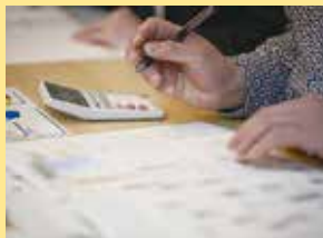
受講生の多くが実務経験無しの経営初心者。オンラインでの受講且つ時間が柔軟なので、仕事や育児等で多忙な方でも受講しやすく設計されている。