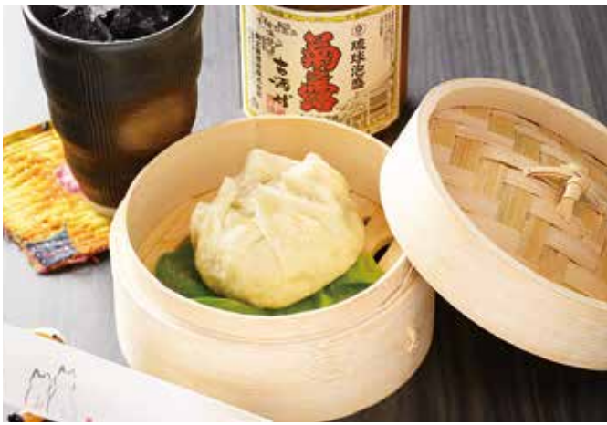
▲手作り豚まん 300円(税込) 粗挽きの豚肉や野菜、とろろ昆布を混ぜたジューシーさとしっかりとした食感が魅力。