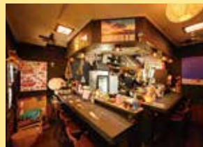
▲カウンター7席が店主を囲むように並び、お一人さまも入りやすい。席数が少ないため、複数人で訪れる際には事前にインスタグラムでDMを送ろう。