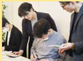
「ビズアカ」の特徴は、受講生同士のコミュニティで生まれる仲間意識。オフラインイベントやグループチャットを通じ代表や受講生間で情報交換できる。