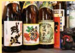
▲泡盛 各600円～(税込) ソフトドリンクや赤しそビールなど豊富なドリンクメニュー。家族連れや0次会など多彩なシーンで楽しめそう！