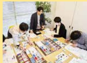
「ビズアカ」メニューのひとつ、戦略マネジメント研修。ゲーム形式で各参加者が経営者となり、コスト意識やキャッシュフロー感覚を習得できると好評。