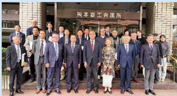
熊本商工会議所で対応していただいた皆様と記念撮影。