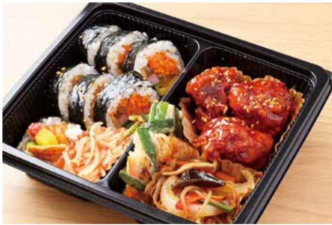
▲パンチャン弁当 1,296円(税込) テイクアウトするのなら、まずは代表作が一度に味わえるこちらのお弁当はいかが？