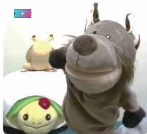
▲カウンセリングに対する敷居の高さを軽減しようと、「清く正しく面白く」をモットーにYouTubeで発信するまのぱべット。

インクルーシブな職場・環境づくりの第一歩にと企業向け、学校向けの相談も受けている。