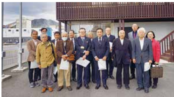
海田バイオマスパワー管理事務所前にて

国土交通省中国インフラDXセンターでは、デジタルを活用した土木技術を、実際の操作やデモンストレーションを通じて、技術の進化に触れる体験をすることができました。