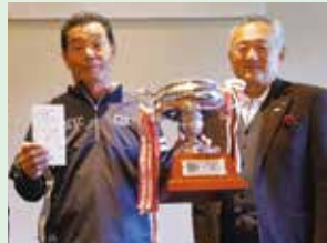
グランドシニア・レディースの部優勝