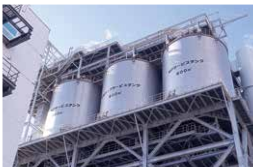
バイオマス発電所

建設工業部会で11月28日に視察研修を行いました。海田バイオマスパワー(株)で発電所を視察し、国土交通省中国インフラDXセンターで最先端のDX技術体験を行いました。