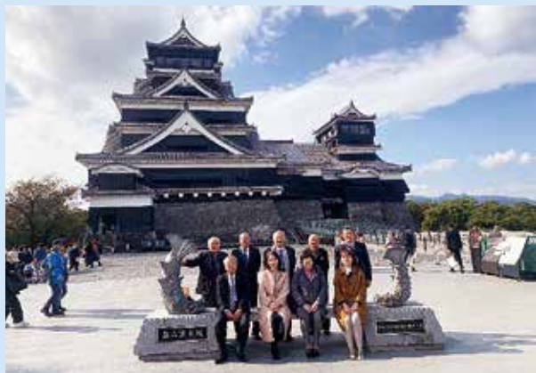
復興のシンボルとして先行して復旧した天守閣。石垣や櫓は復旧作業中で、城全体の復旧見込は2052年度。

令和6年11月20日(水)・21日(木)の日程で参加者22名にて、視察研修会を実施しました。