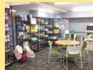
難しくなった立ち上がりや歩行を支援する福祉用具をレンタル、販売。豊富な品揃えで在宅生活をサポート。