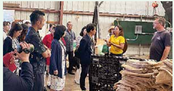
伝統的なコーヒー農園でもAIを使った選別を取り入れている