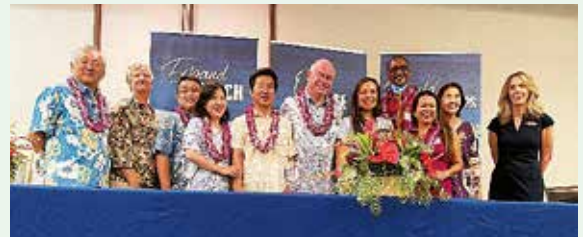
コナ・コハラ商工会議所主催の「ビジネス・ランチョン」でハワイ郡長他との記念撮影

当所は、2006年に米国ハワイ郡のコナ・コハラ商工会議所と姉妹提携を締結しており、様々な交流を続けています。今回は、本年4月に廿日市市がハワイ郡(ハワイ島)と姉妹都市提携を締結したことを機に、廿日市市長をはじめとした廿日市市の訪問団にあわせて交流事業を実施いたしました。