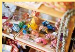
▲ハンドメイドイベントに月2回参加するほど、豊富なラインナップを展開している雑貨コーナー。ランチを楽しみながらショッピングも♪