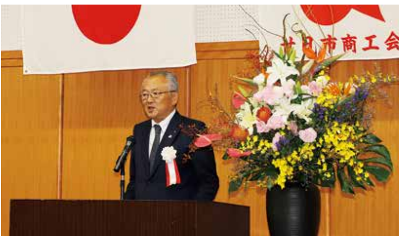
受賞企業様へのお祝いとさらなる発展を願う澁谷会頭