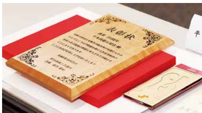
100周年以上の方には木彫りの表彰盾を授与。対象事業所の皆様への記念品は廿日市市産ひのきを使用したスマホスタンド