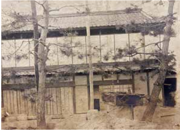
創業当初の事務所外観

私の祖父にあたる初代は、元々宮島にある業者に石工として雇われて働いていました。石工とは石材を加工、彫刻、つやだしなどを行う職人のことを言います。旅館や神社に関わる多くの事業に従事する中で、腕を評価され独立したと聞いています。