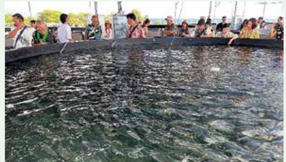
海洋深層水を使ったカンパチの養殖