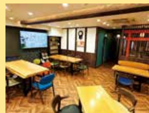
デイサービス「TEGOALL宮島口」をR6年8月にオープン。最大の魅力は食！料理を通じて心身の活性化を促す。