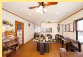
▲玄関のインターホンを押したら、スタッフの人が出迎えてくれるスタイル。靴を脱いだら、まるでおうちのリビングでくつろぐような気分に。