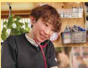
医療・介護の専門職員が自宅に訪問。在宅ケアサービスを通じて療養生活に安心を提供している。