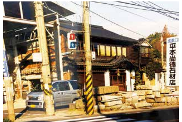
平成14年の事務所外観。加工場も併設していた。

広島に戻り仕事を一人で任せられるようになると、今まで以上に「良いものを作りたい」、「二代目である父