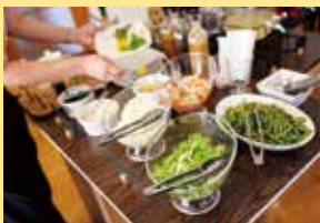
▲ビュッフェは、北広島町の農家から届く旬野菜も用いて作られている。ランチプレートが来るまで、心ゆくまで味わって。