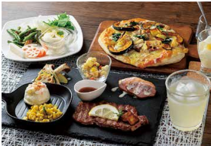
▲スペシャルプレート 1,650円(税込) 手作り生地に季節の野菜やチーズをトッピングしたピザは、ふわふわとろーりの食感！