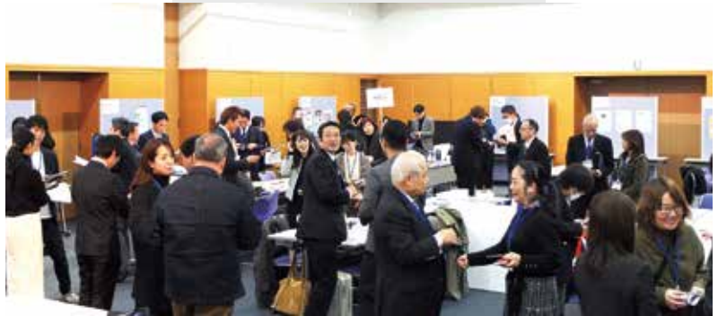
2023年度に実施した交流会の様子。定員を上回る60名以上の参加で賑わった

エリアや業種、業態の異なる事業者同士のマッチングの機会を提供します。新たなつながりを構築することで、新事業の展開、新商品やサービスの開発につなげます。