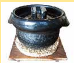
雲井窯・黒楽御飯鍋で炊き上げる締めのご飯は、一度は味わいたい、蔵を代表する料理。