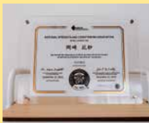
トレーナーの国際ライセンスを保有。科学的根拠に基づいて最適なトレーニングを行っている。