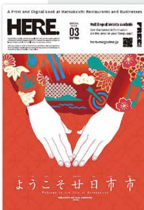
2023年度は外国人向けタブロイド誌を3冊発行