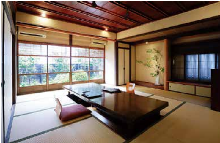
1枚板で作った大きなテーブルと、蔵を眺めることができる大きな窓が印象的な母屋の一室。