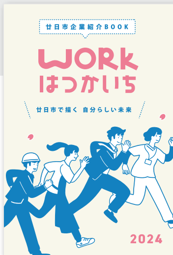
企業紹介パンフレットを学生に配布

市内企業の特徴や求人情報を地域の中高校生に紹介し、地元就職への意識付けや進学で本市を離れた大学生等のUターン就職の創出を目指します。