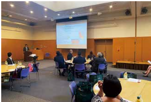
奥田事務局長から廿日市市について紹介