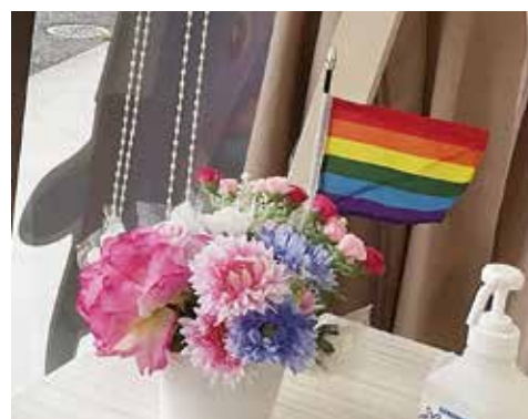
店舗入口に飾られたレインボーフラッグ。 沿道からもさりげなく見える位置に。