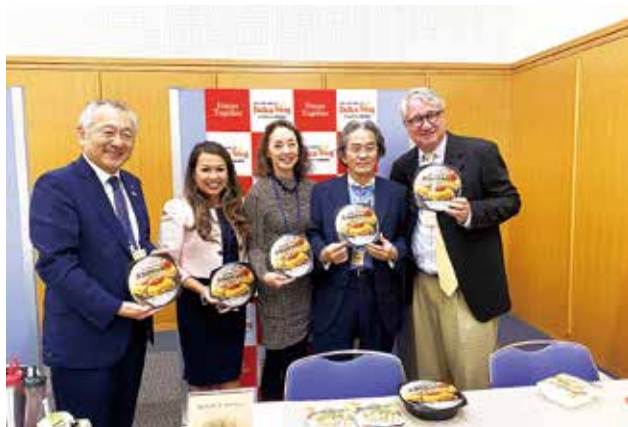
デリカウイングさんのブースにて記念撮影