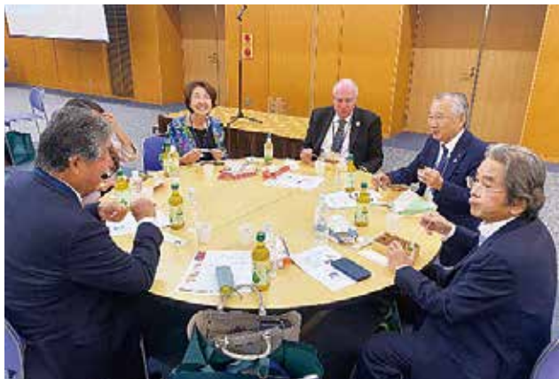
ランチタイムではあなご弁当など日本らしいメニューが好評