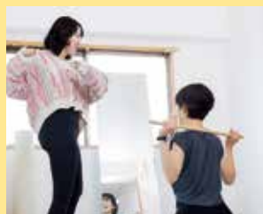
100名様限定で特別価格の体験会を実施中。ひとりひとりに合わせたメニューで食べても太りにくい身体づくり。