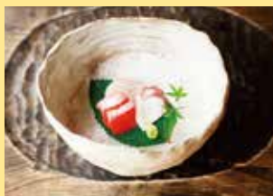
瀬戸内海産を主としたお造り。店主手作りの器も料理を引き立てる。