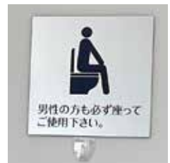
男女共用トイレの表示。

賃貸契約書から性別の記入欄をなくしたり、店舗のトイレは男女共用にしています。当事者以外の方にも「世の中にはこんなニーズを持った人がいる」という気付きを与えられます。