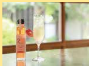
「はつかいちこの食前酢 1,200円(税込)」 地元で採れたいちごと千日酢造の千日酢を使った、蔵のオリジナル商品。