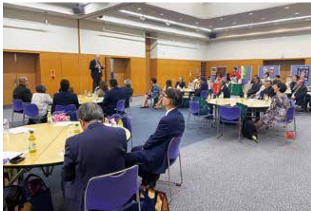
挨拶をするミッチ・ロスハワイ郡長