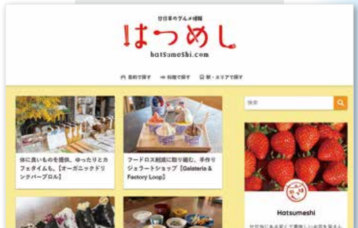
廿日市ナンバーワンのグルメサイトとして約130店を紹介している

グルメ情報動画チャンネル『まんぷく倉ちゃん』を各種SNS版（Youtube、Tiktok、Instagramなど）のショート動画にしてファンを拡大します。