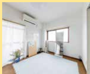
金・土・日はレンタルスペースとして貸出もしている。駅近で様々な用途で利用できる。(1h,1,500円)