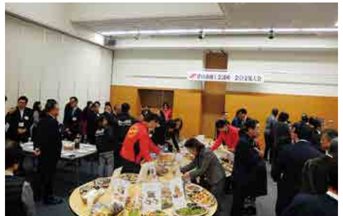
令和元年度 会員交流大会の様子

令和2年度は、オンラインで開催し ましたが、新型コロナウイルス感染拡 大状況によっては、会場で感染状況の 改善が図れたら開催をする予定です。