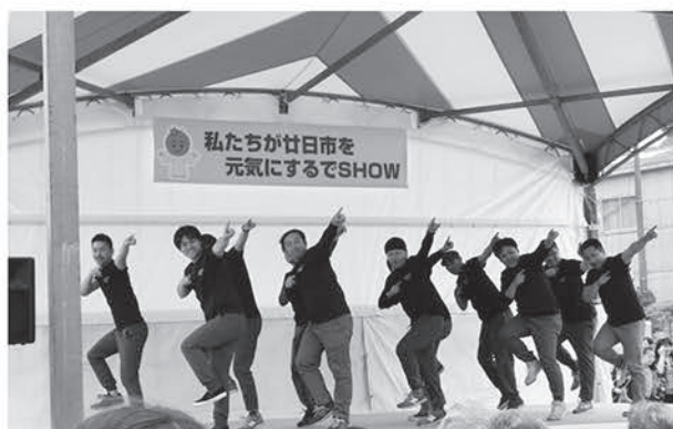
▲身体にムチうちつつ練習した成果。キレッキレのパフォーマンス