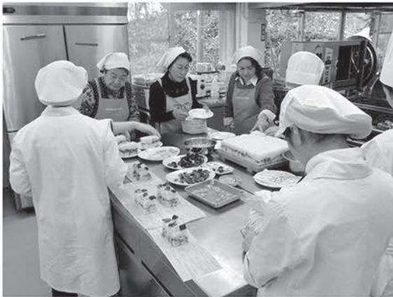
▲山陽女子短期大学での桶ずし講習会の様子

最近では廿日市市郷土文化研究会に協力していただいています。地元食材等を手配してもらったり、お米や大きな道具など力仕事も多いので助かっています。 毎年定期的に主催してくださる桶寿司講習会に共催し、山陽女子短期大学食物栄養学科の生徒と廿日市小学校の生徒に作り方を教えています。核家族が増えているため、大きな釜でたくさんの量を作ることは珍しいようで皆さん驚きながらも楽しんで作っていました。