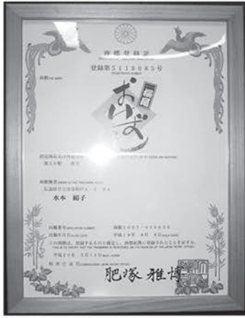
▲桶ずしの商標登録証

桶寿司の最大の特徴は四角い桶の木枠で押し寿司にすること。大きな木枠で高さが20cmくらいあり、椎茸やニンジン等の具を寿司飯の間にサンドする形で断面は美しい層をなしている。厚みのある檜造りの木枠が餅米を混ぜた寿司飯の水分バランスを絶妙に保っている。