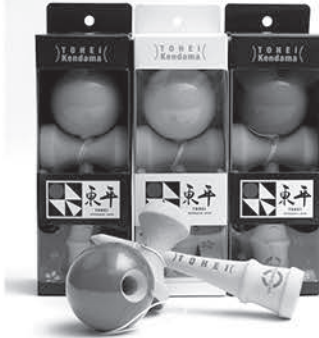
新広島みやげグランプリ2016 委員会賞を受賞した「けん玉 東平」

新しくなった広島駅を舞台に「新たな広島の魅力」を育て、発信することをコンセプトに開催された新広島みやげグランプリ2016。800件以上の応募の中から(株)本郷が立ち上げた「はつかいちけん玉カンパニー」のブランド「けん玉 東平」が見事「委員会賞」を受賞。廿日市内では唯一の受彰者として、3月27日に授賞式に出席した。