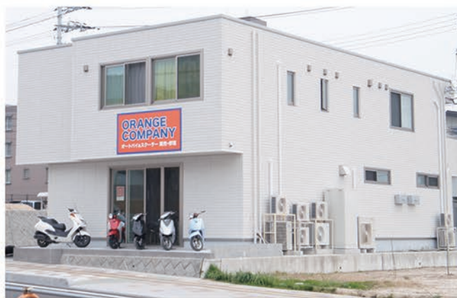
▲空手・キックボクシングエクササイズの道場を併設した店舗は、オレンジの看板が目印。

バイクの修理・販売のオレンジカンパニーが、移転オープン。以前から地元の子どもたちを中心に空手道場を開いており、店舗移転を機に道場を併設し、キックボクシングエクササイズの教室が新設された。男性女性問わずどなたでも参加できる。都市開発が進むJR廿日市駅北の好立地も◎。