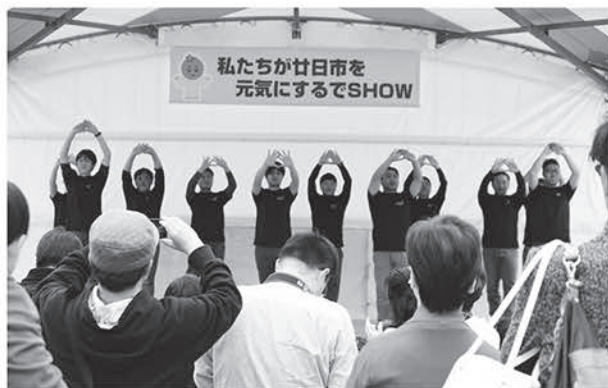
▲青年部員一致団結した華麗なダンスを披露しました。