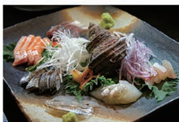
▲日替わりの新鮮な「お造り盛り合わせ」は、オススメのお得な一品。魚料理は旬に合わせて近海の新鮮な素材にこだわる。仕込みにも丁寧な仕事が施されており、自家製一夜干しや西京焼きなども人気だ。