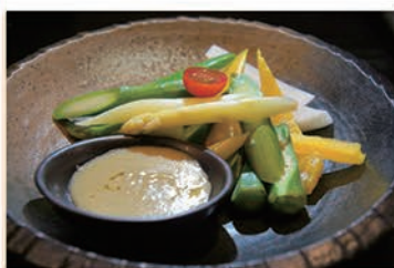
▲「季節野菜のパーニャカウダ」。ソースを和風にするのであっさりとした食べやすさで、野菜本来の旨味が楽しめる。この野菜も地物を中心に新鮮さにこだわり、何より旬を大切にしている。