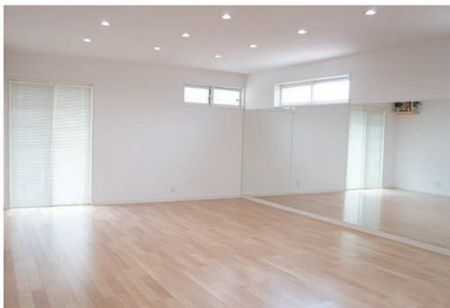
▲真新しい快適な道場で思いっきりストレス発散!