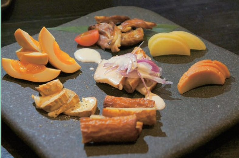
▲店内で作る「燻製の盛り合わせ」。いずれの料理も見た目に綺麗で、食欲をそる。居酒屋レベルを超えた丁寧な仕事が評価され、ミシュランへの掲載に繋がっている。

JR宮内串戸駅から徒歩2分の好立地にある人気居酒屋。木の温もりが暖かい雰囲気の外観が目印。いつ来ても飽きずに楽しめるようにと、季節の旬に合わせて毎日メニューを入れ替えている。『ミシュランガイド広島 2013』に「ビブグルマン」として掲載され、予約で埋まる人気店に。客層も若い人から家族連れや年配の方まで幅広い。飲み放題付きのお得なコース料理(4,200円〜)が人気。特に週末は予約が必須。