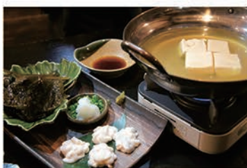
▲「生ワカメと白子のしゃぶしゃぶ」。生ワカメは茹でると鮮やかなグリーンに。「お客さまに飽きられないように毎日メニューを考えています」とオーナーが言うように、100種類近いメニュー表を毎日手書きで作っている。